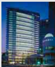
松下电工 总公司大厦 (东京 汐留)

位于汐留的松下电工株式会社总公司的大厦是本着百年建筑的设计理念建造而成，我们致力于与2003年度(建成时)相比，削减能源使用量15%的推进活动。为此，以节能调节*的思路为本，在详细数据的基础上持续改善控制、运用机能，以实现照明、空调设备的合理运转并有利于环境。同时，通过设备管理人员及公司内外部专家参与的节能推进活动、以及有效利用共通“可视化”分析工具实施设备高效运转等手段，活动的第2年，相对于3,670万日元的投资额，取得了削减4,438万日元的效果，能源使用量削减13.8%的投资高效回报。