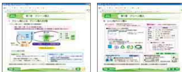
■e-Learning系统中绿色购买的培训内容画面