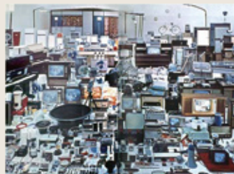
丰富人们生活的主要家电商品群