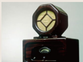
在收音机的生产活动中，为了整个行业的发展，购买了重要的专利并公开

进入21世纪，对于企业的社会责任来说，也必须从整个地球的角度来思考。这个想法也体现在“Panasonic ideas for life”的品牌口号中。我们向全世界的人们提供明天的生活方式提案，并通过它不断为地球的未来和社会的发展作贡献”。这已经以“品牌宣言”的形式，向全世界的客户作出了承诺。今后，在 Panasonic 品牌的指引下，进一步努力开展工作，实现21世纪的社会责任，“为地球的未来和社会的发展作贡献”。